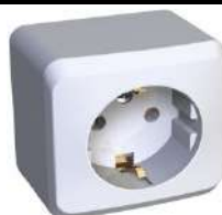
32. Розетка Эюд о/у с заземлением белая

https://petrovich.ru/catalog/18603/106903/