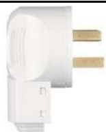
35. Вилка силовая с/у 2P+N, 32А, 250В, Schneider Electric Blanca белый

https://petrovich.ru/catalog/18603/106881/