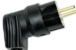
42. Вилка с заземляющим контактом угловая

https://petrovich.ru/catalog/1389/103038/