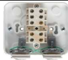
38. Коробка клеммная для подключения электроплит Schneider Electric открытая установка с заземлением 3 фазы 40 А 380 В IP44

https://petrovich.ru/catalog/124556591/503052/