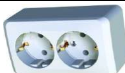
34. Розетка двойная Эюд о/у с заземлением белая

https://petrovich.ru/catalog/18603/106877/