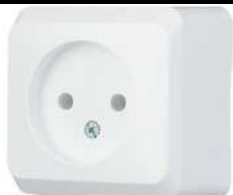
31. Розетка Эюд о/у без заземления белая

для подключения электрики Вам может понадобиться: