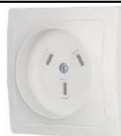
36. Розетка силовая с/у 2P+N, 32А, 250В, Schneider Electric Blanca белый

https://petrovich.ru/catalog/7134/503051/