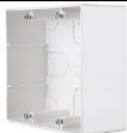
37. Коробка подъемная для силовых розеток о/у Schneider Electric Blanca белый

https://petrovich.ru/catalog/124556591/503050/