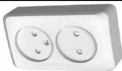
33. Розетка двойная Эюд о/у без заземления белая

https://petrovich.ru/catalog/18603/106907/